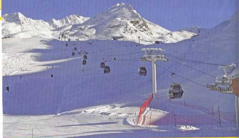
Les télécabines Cairn-Caron à Val Thorens, l'une des réalisations de Seirel Automatismes en 2007

Depuis le 10 juillet, Seirel Automatismes a intégré le groupe Gérard Perrier Industrie. L'entreprise évolue en interne, et les innovations techniques sont toujours là.