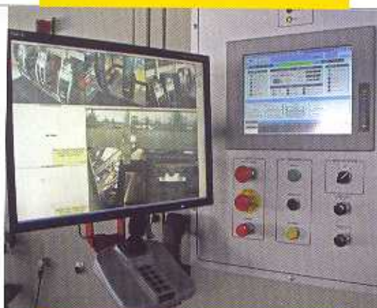
L'installation électrique et de supervision réalisée par Seirel Automatismes à Val Thorens.